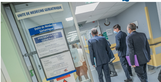
Unité de Médecine Gériatrique du CH Simone Veil

Face à l'augmentation des besoins en soins pour les personnes âgées, le Centre Hospitalier Simone Veil de Beauvais ouvre l'UMG 2, portant la capacité totale du service de médecine gériatrique à 46 lits . Ce service dédié aux hospitalisations de courte durée (séjour moyen de 8 jours) facilite les admissions directes depuis le domicile, évitant ainsi le passage par les urgences.