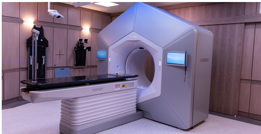
Accélérateur de radiothérapie

Le Centre Hospitalier Simone Veil de Beauvais franchit une étape majeure dans la prise en charge des patients atteints de cancer avec un investissement de 8 millions d'euros. Deux accélérateurs de radiothérapie de dernière génération s'y ajoutent, combinant technologies innovantes et traitements efficaces.